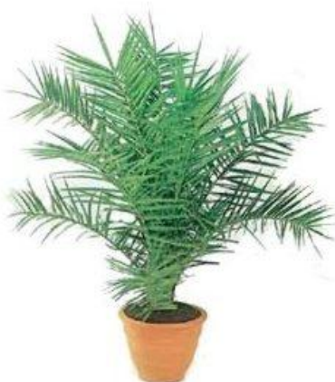
Palmera de Canarias