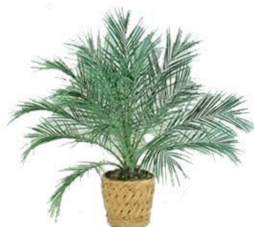
Palmera datilera enana