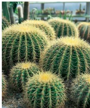
Asiento de suegra