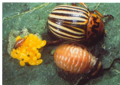
Escarabajo de la patata